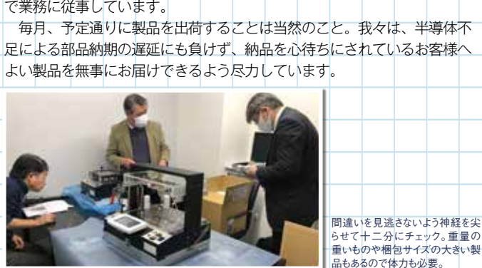
間違いを見逃さないよう神経を尖らせて十二分にチェック。重量の重いものや梱包サイズの大きい製品もあるので体力も必要。

生産管理部は、関東近郊の倉庫で日々検品作業をしています。納品数の間違いを見逃してしまうとすべての工程に影響が生じてしまうので、ただ数量チェックするのではなく全業務のスタートラインに立っている気持ちで業務に従事しています。 毎月、予定通りに製品を出荷することは当然のこと。我々は、半導体不足による部品納期の遅延にも負けず、納品を心待ちにされているお客様へよい製品を無事にお届けできるよう尽力しています。