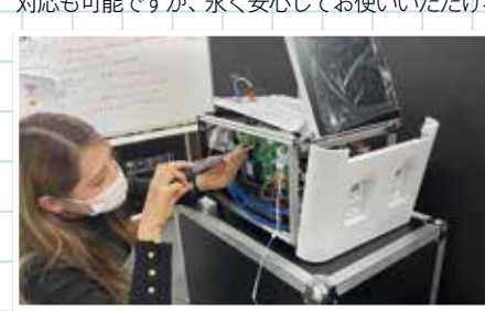
個人差を抑えられる専用検査治具を作成し、性別問わず検査や修理が可能な仕組みを構築。多様性を重視した取り組みを始めている。

開発技術部では、サポート部が要検査と判断した案件を引き継ぎ、代替機器の発送から修理後のフォローまでの一端を担っています。 当部署には女性スタッフも駐在。女性ならではの“気付き”が得られ、固定観念に縛られた作業方法から脱却できていると感じています。そんな我々のウリは“先を見据えた提案”。もちろん修理費用を安価に抑えたその場しのぎの対応も可能ですが、永く安心してお使いいただける修理対応を心がけています。