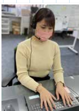
お客様に自然と名前を覚えていただけるようなコミュニケーションを意識して、ナンバーワンのサポートセンターを目指す。

365日フル稼働の対応と信頼構築で満足度アップへ サポート部では、製品の使用方法や修理・故障のほかにも、製品導入後の運用や使用時の禁忌事項など、幅広い相談を承っています。 サポートセンターは土日も対応し、製品のトラブルにも即日対応。我々は問題解決だけでなく電話口でのコミュニケーションを大切に、お客様に製品を導入してよかったと思っただけのような信頼構築に努めています。また、他社製品の情報や美容の知識を深めて切磋琢磨し合うことでチーム全体の士気も高めています。