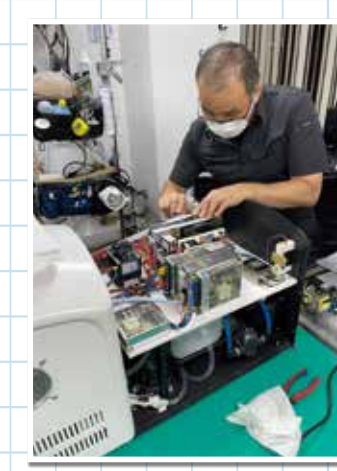
プラスアルファの機能を加えるなど、低価格・多機能で他社製品と差別化を図れる製品づくりに力をいれている。

「結果の見える健康・美容サービスを身近にし、世界を豊かにしていく」。弊社のビジョンを具現化した製品に、クオリティ、コスト、使いやすさ、デザイン性もプラスした逸品を届けたい一念で開発に取り組んでいます。我々は、開発期間が短いなかでもお客様のご要望・社員の意見を最大限取り入れる努力をしています。複数の仕入れ先を開拓し、適切な在庫を確保することで実現させました。今後も顧客満足度アップのために挑戦し続けます。